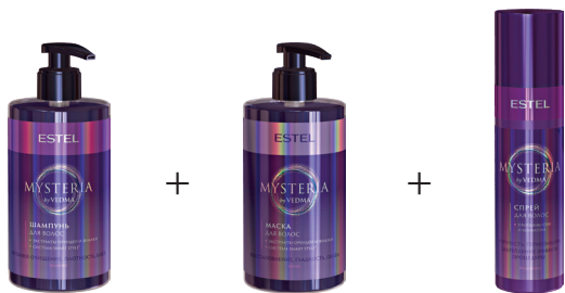
Шаг 1 Шампунь для волос ESTEL MYSTERIA 435 мл