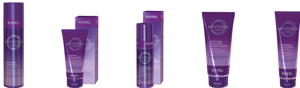
Вечерний шампунь для волос ESTEL MYSTERIA 250 мл