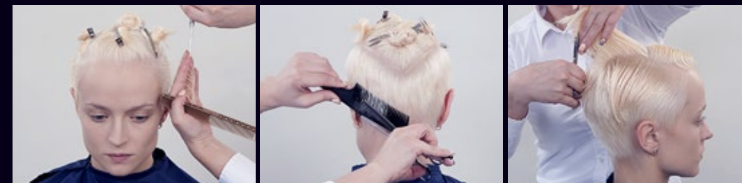
Простригите висок с углом оттяжки и среза 90/90